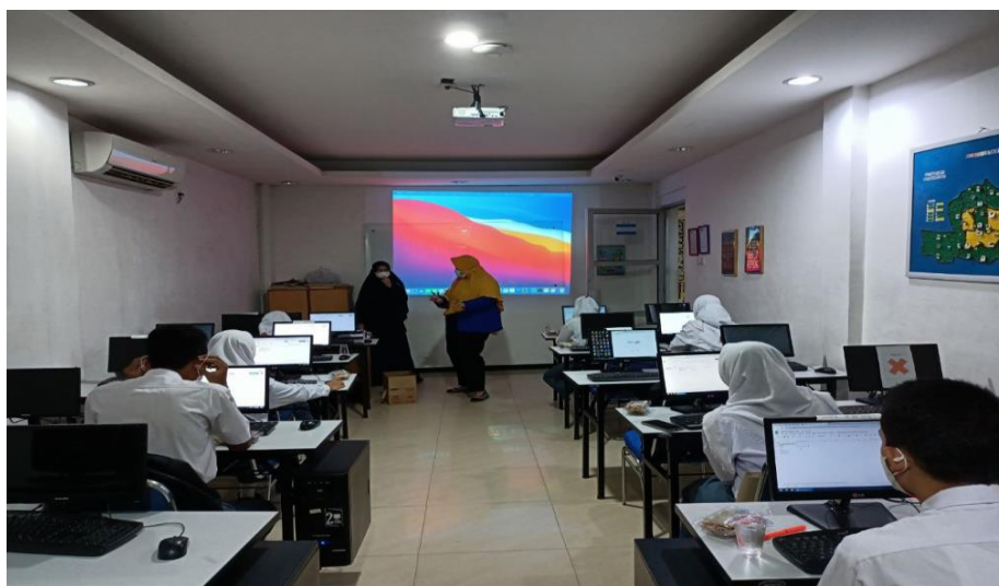
Gambar 3: Tanya jawab dan Evaluasi kegiatan