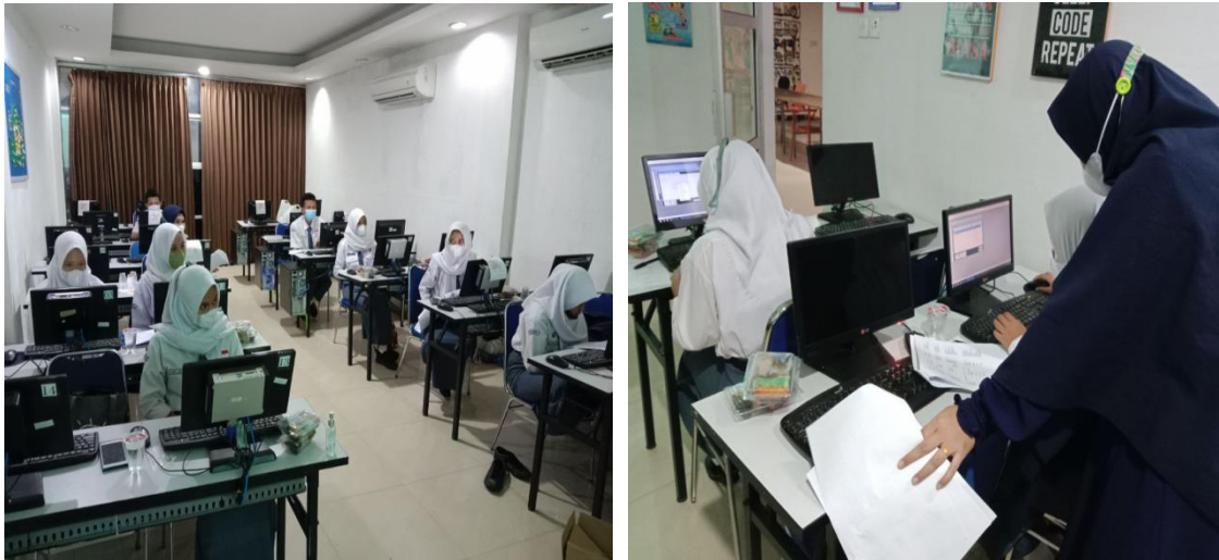
Gambar 2: Praktek MYOB Accounting