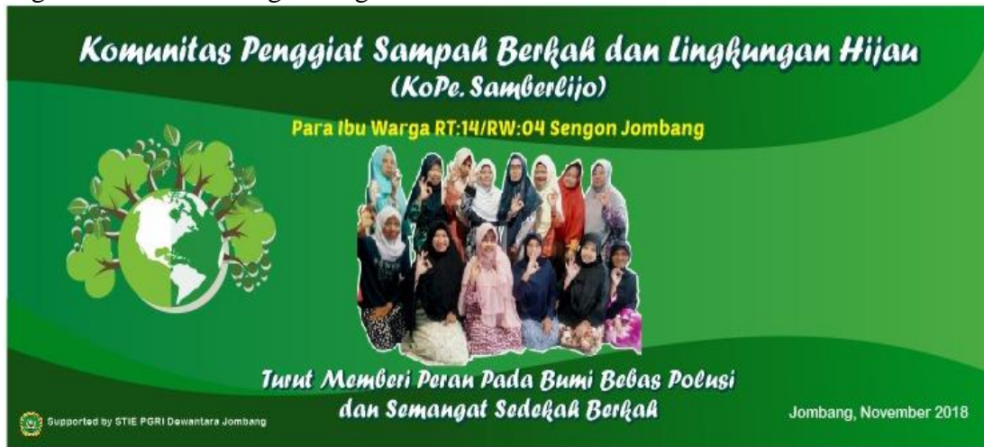
Gambar 3 : Komunitas Penggiat Sampah berkah

usahanya maka dihitung sebagai sedekah yang dikelola dan akan digunakan untuk kegiatan amal sholeh agar warga semakin berkah.